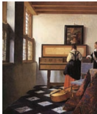
Vermeer Van Delft, Sat klavira , oko 1657. god.

Naznačite strjelicom smjer upada svjetla na slici.